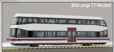
Bild zeigt TT-Modell