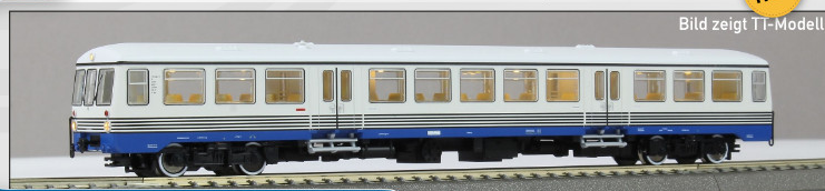
Bild zeigt TT-Modell

weitere Ausführungen dieser Baureihe erhältlich