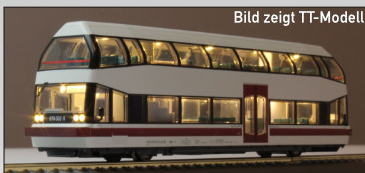
Bild zeigt TT-Modell